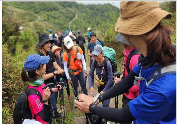
實務-嚮導途中實例分享及學員提問