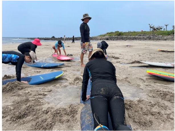
推廣-下水前教練逐一確認動作