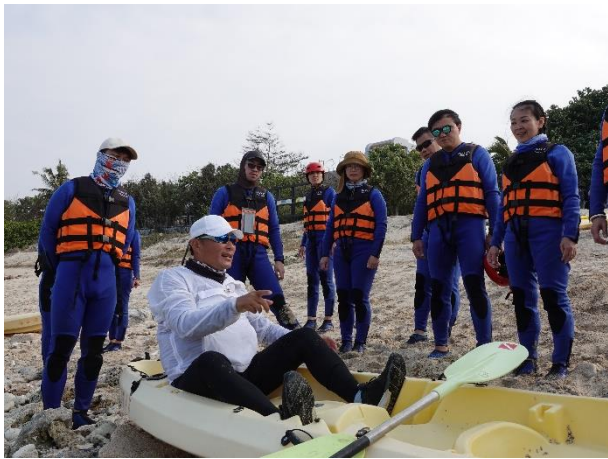
實務-正確穿著設備專業知能分享