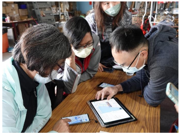
實務-分組探論規劃騎乘路線