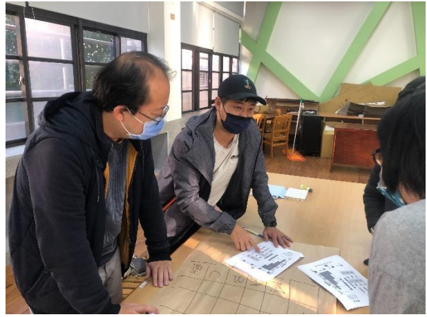
理論-依矩陣進行風險評估擬定應對措施