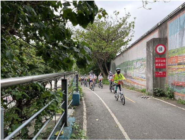
推廣-學生自行車體驗教師帶領騎乘