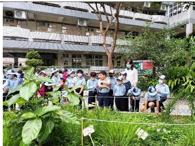
說明：帶領學生認識新的植栽