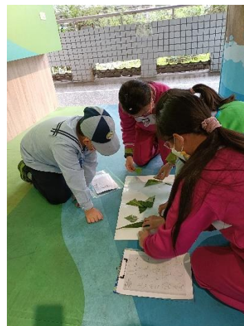
說明：分組進行葉形拼圖