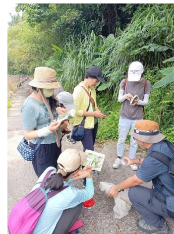
說明：教師社群研習-龜子山橋探訪蝴蝶