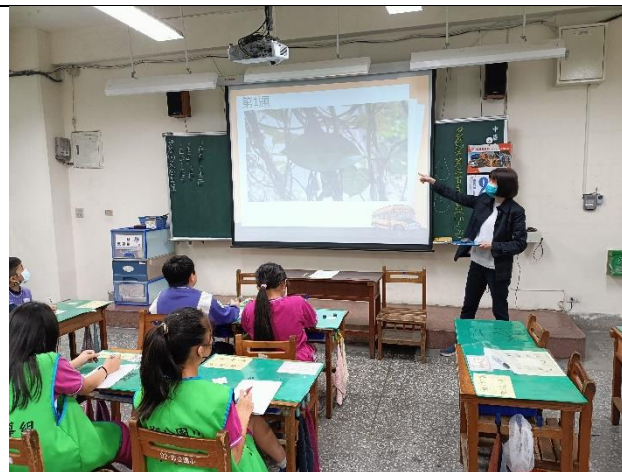
說明：校園植物大考驗