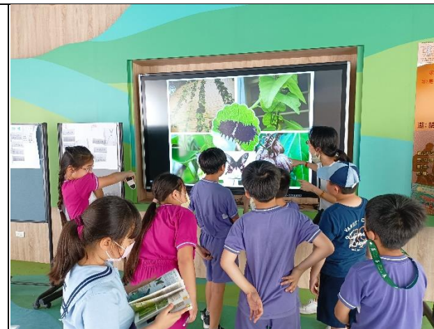
說明：認識蝴蝶的一生