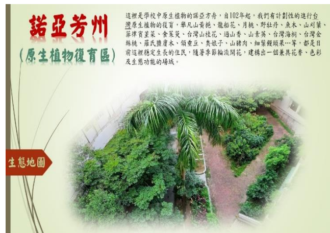
說明：原生種植物復育區圖卡