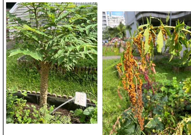
說明：野耕園的刺蔥與紅藜