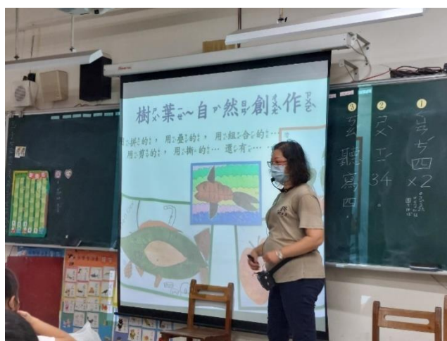
說明：兒童環境教育課程-二年級