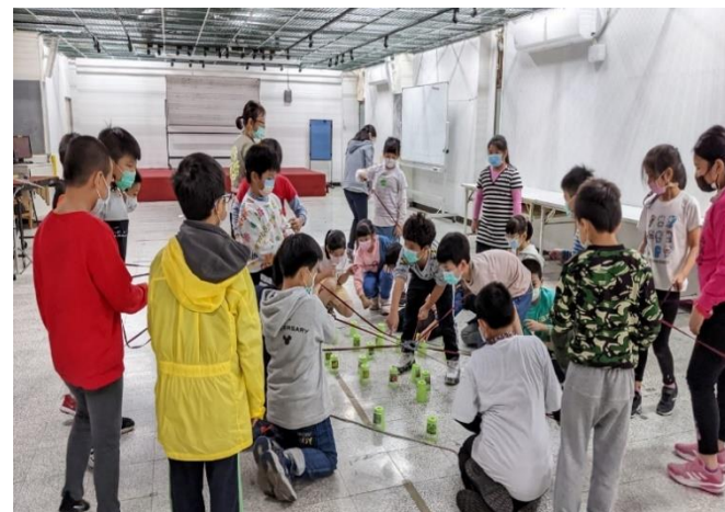
說明：兒童環境教育課程-三年級