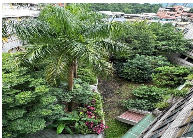
說明：原生種植物復育區現況