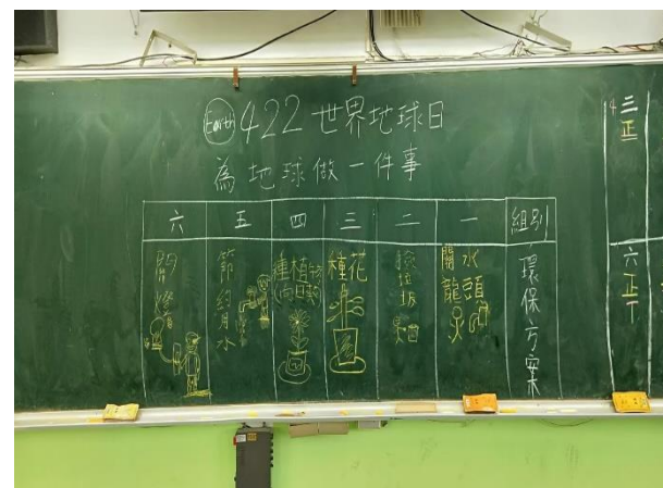
說明：為地球做一件事