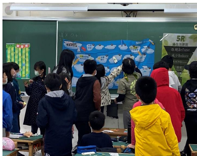
說明：兒童環境教育課程-五年級