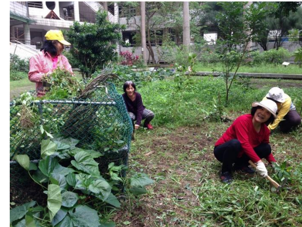
說明：生態志工執勤~整理原生植物復育區