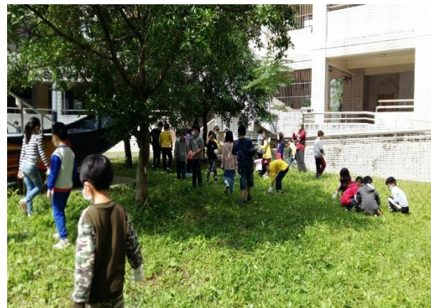
說明：入侵種小捕快