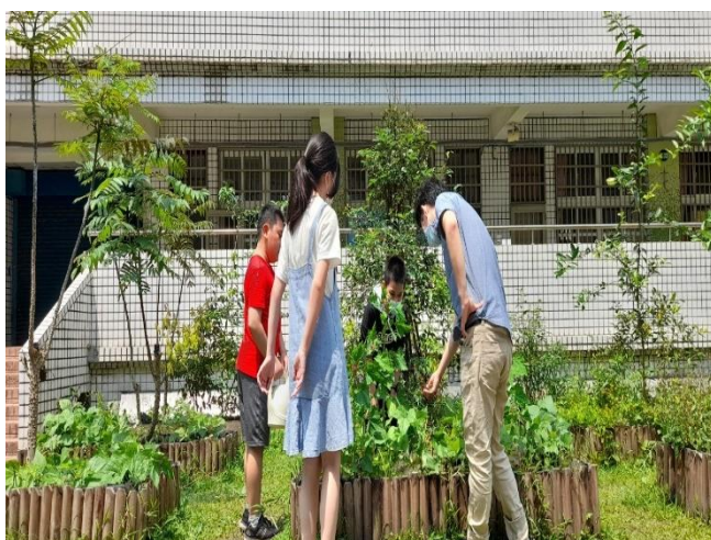
說明：綠手指小志工解說訓練