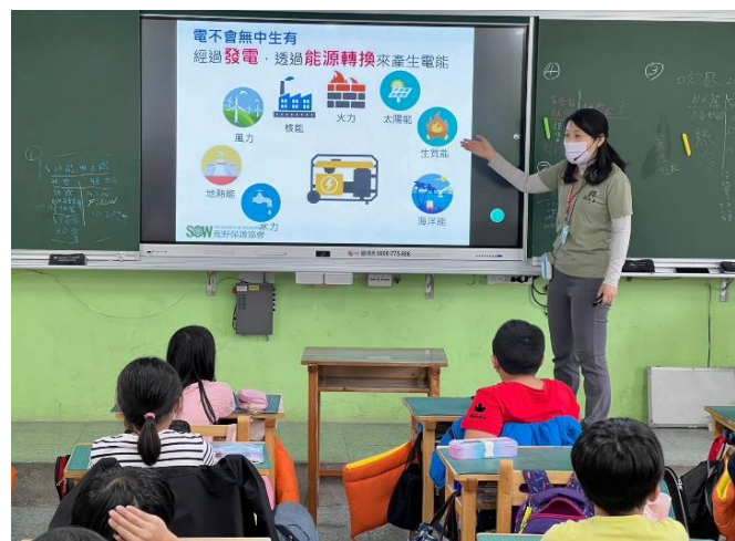
說明：兒童環境教育課程-四年級