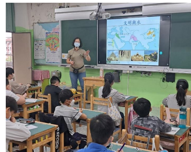
說明：兒童環境教育課程-六年級