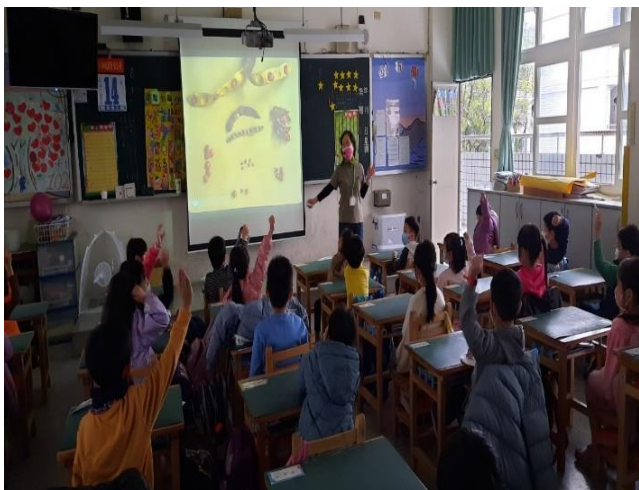
說明：兒童環境教育課程-一年級