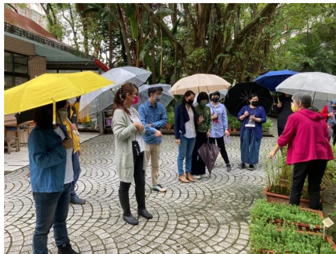
說明：教師學習社群-水生植物解說介紹