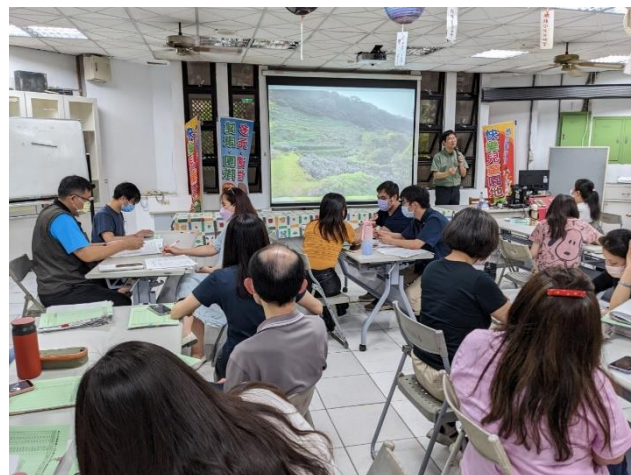
說明：教師環境教育研習-淡蘭古道生態