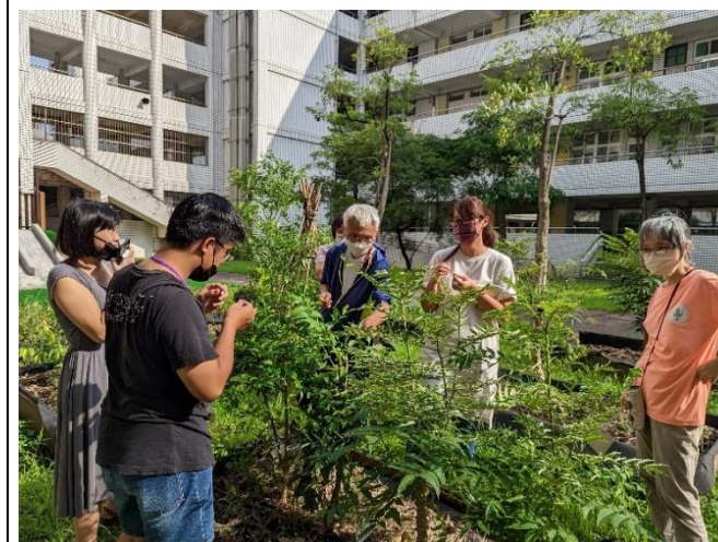
說明：教師學習社群-認識野耕園