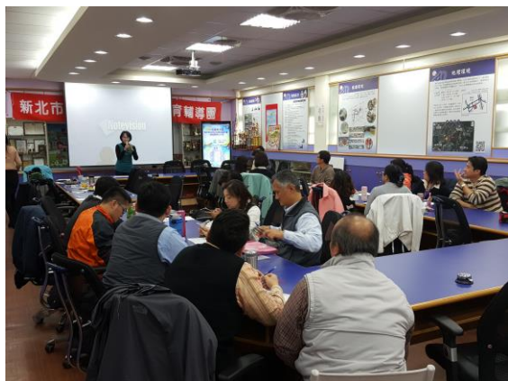
說明:蕙雯主任說明流程