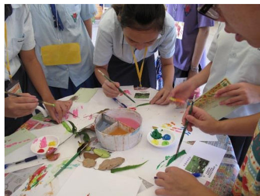
照片說明：配合學校主題節日辦理相關永續校園議題活動。