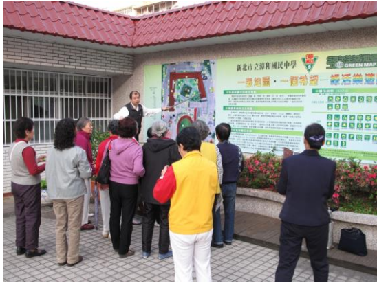
照片說明：家庭、社區共同參與永續校園推動。