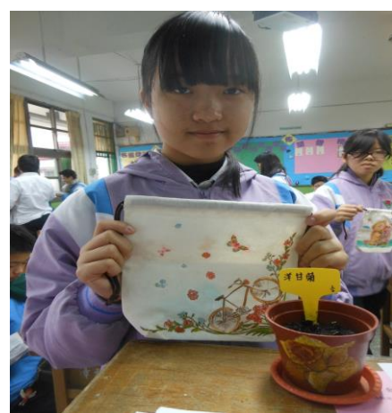
照片說明：學生運用堆肥種植洋甘菊並裝飾束口袋，讓漳和堆肥”袋”著走!