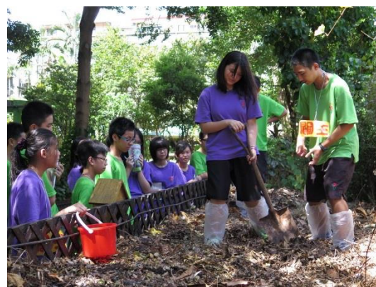
照片說明：資源再使用。