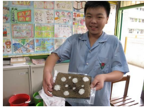
照片說明：學生使用學校廢紙製成手抄紙作品。