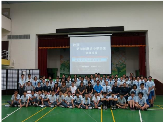
照片說明：與他校結盟共推動永續校園-新加坡康陪中學蒞校參訪