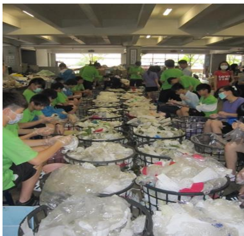
照片說明：到中和靜思堂進行資源回收分類實習。