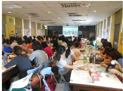
照片說明：建立全校師生共識- 舉辦教師綠活備課日