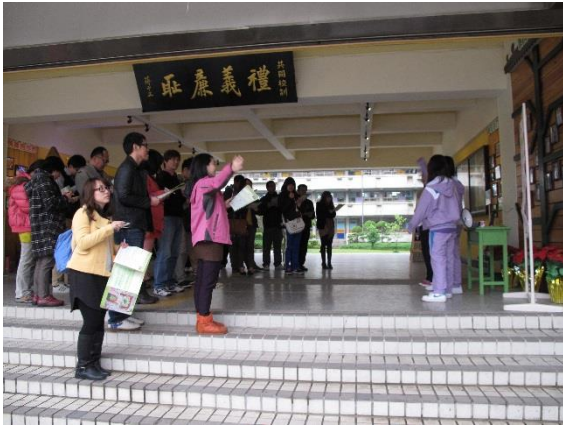
照片說明：提供學校永續校園發展特色-辦理2014環境教育輔導-雙和分區座談