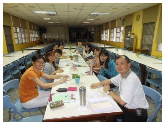
照片說明：教學、行政團隊跨處室整合組成環教團隊