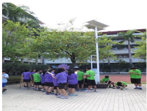
照片說明：每學年辦理能源教育活動。