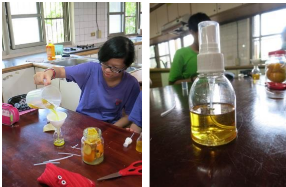
照片說明：學生製作回收橘皮清潔劑，可清潔生活用具。