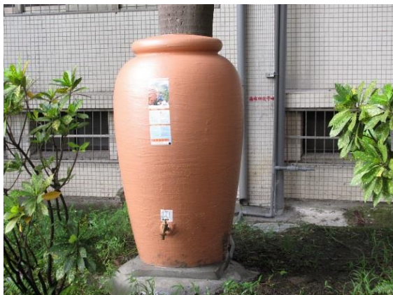
照片說明：訂定能源使用策略-雨水再生水利用，雨水沖廁規劃。