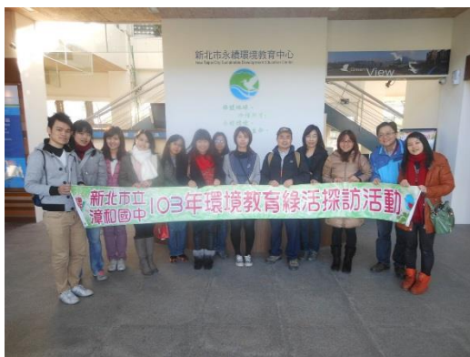
照片說明：學校環教團隊定期進修