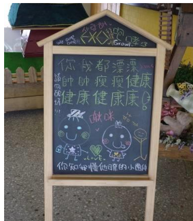
照片說明：資源再使用-使用小黑板宣導，減少海報紙用量