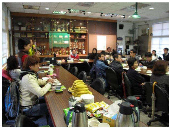
照片說明：提供學校永續校園發展課程亮點