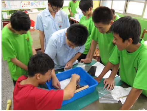
照片說明：學生使用學校廢紙進行手抄紙製作。