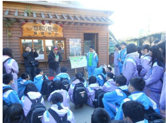
照片說明：與社區民間組織課程結合。