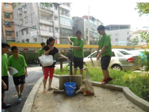
照片說明：生態資源循環使用。