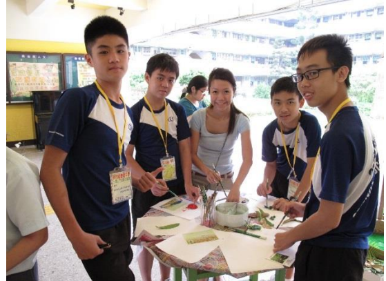
照片說明：與他校結盟共推動永續校園-新加坡康陪中學蒞校參訪