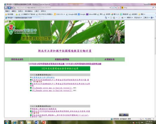
照片說明：建立分享網路平台