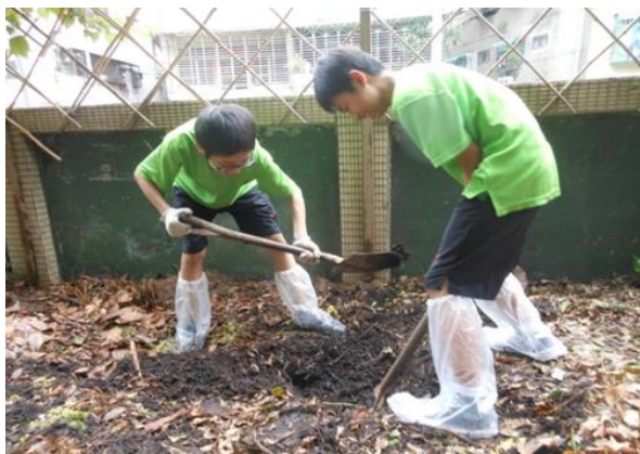
照片說明：學生進行落葉堆肥實作，透過課程進行種植再利用。