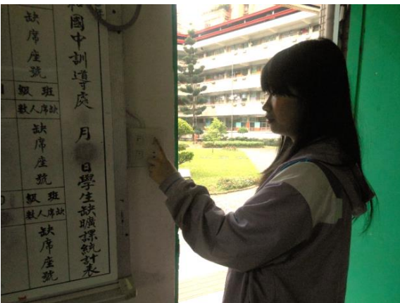
照片說明：節電行為-實施午間關燈