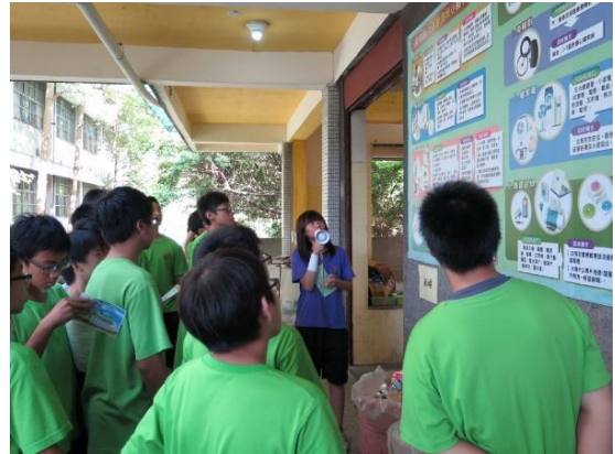
照片說明：於綠活環保小棧辦理回收分類推廣研習。