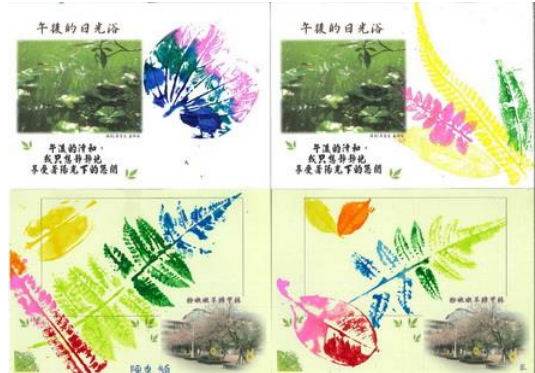
照片說明：學生運用落葉進行葉拓活動，寄明信片寄到國外。