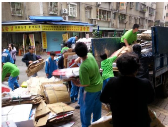
照片說明：環保服務-學生假日街道服務。