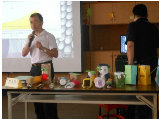
照片說明：每學年辦理教師專業成長活動。