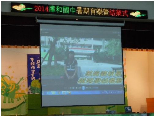
照片說明：校長支持與參與- 暑期環教營隊結訓勉勵