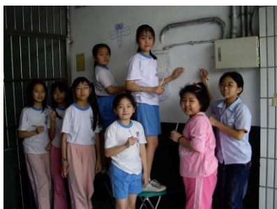
樓梯的牆面原本模樣