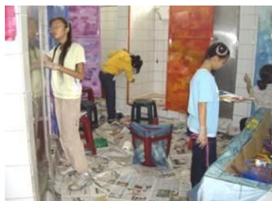
會勘研討及師生彩繪活動