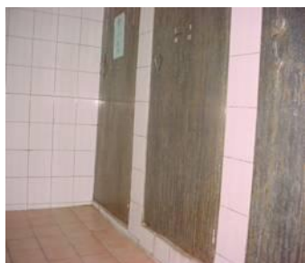
嚴重侵蝕污漬不鏽鋼門

此外，也有相關的報導提及：「很多小朋友喜歡在牆壁上塗鴉，但是在家裡這樣行為可是不被允許的，最近 汐止的崇德國小 就開放一面牆讓小朋友盡情揮灑，這是非常有創意的一件事！」