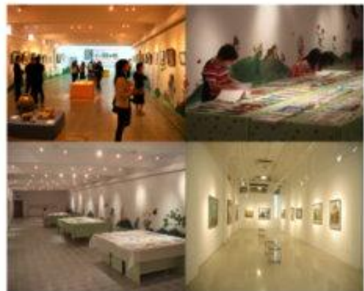
1 藝術人文藝術館-崇仁樓地下室整修及地坪整修。 完成後辦理藝術展、評選教科書、作業展活動。