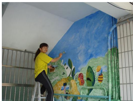
教師彩繪樓梯的牆面